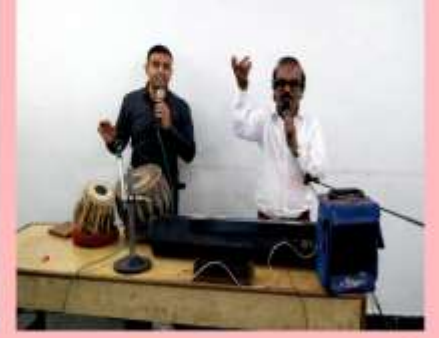
Wishing them a healthy, active and contented life ahead.