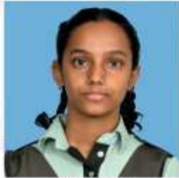
YASHIKA CLASS- X (93.8%)