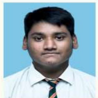
KRISH SUB- ECO (94)

“The Best way to predict your Future is to create it.”