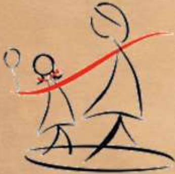
गौश्री पाँचवीं ब

बेटी हूँ मैं कली हूँ, घर-घर खिली हूँ, जिस घर खिली वह स्वर्ग है, यह कली उस घर का गर्व है। इस कली को फूल बनाओ, पढ़ा-लिखा कर काबिल बनाओ। काबिल होगी इस गली, खिलेगी ना जाने किस गली। जहाँ जाए स्वर्ग का एहसास कराए, माता-पिता को गर्व कराए। आओ इस कली को बचाए, भ्रूण हत्या बंद कराए। बाल-विवाह पर रोक लगाए, काबिल हो जाएँ तभी ब्याहें। आओ कली को आत्मनिर्भर बनाएँ। आत्मनिर्भरता में है शान, दो परिवारों की है ये जान।