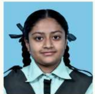
SIMONDEEP SUB- MATHS (95)