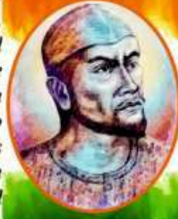
स्वतंत्रता सेनानी पीर अली खान जन्म: 1812 निधन: 7 जुलाई 1857