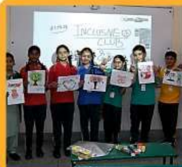
INCLUSIVE EDUCATION CLUB