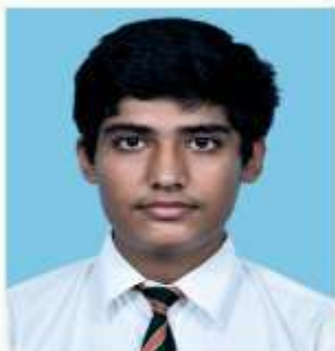
KALASH SUB- MATHS (95)