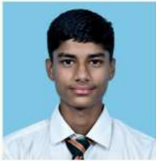
MANNAN SUB- I.P (100)