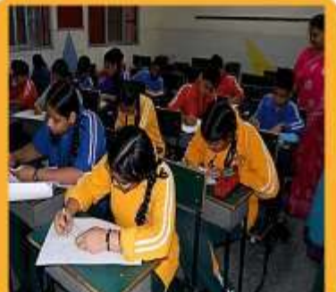
SPIC AND SPAN CLUB