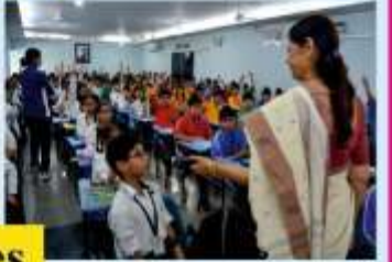
Table Manners and Social Etiquettes