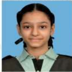
DRITHI CLASS- X (92.8%)