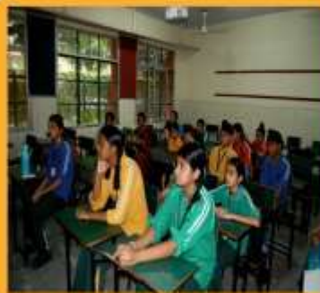
READERS' HIVE CLUB