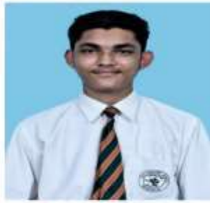
HARSHAL XII (SCIENCE STREAM) IIND- 93.8%